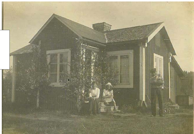
Inez och Elsa i Inez' fars stuga i Silje. Fadern syns till höger med en katt i famnen.