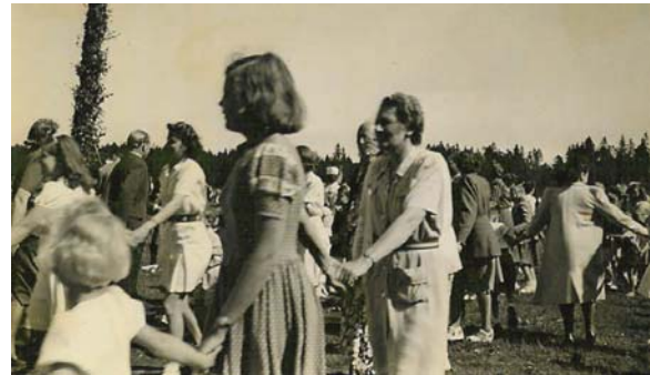
Midsommarfest på Dalarö