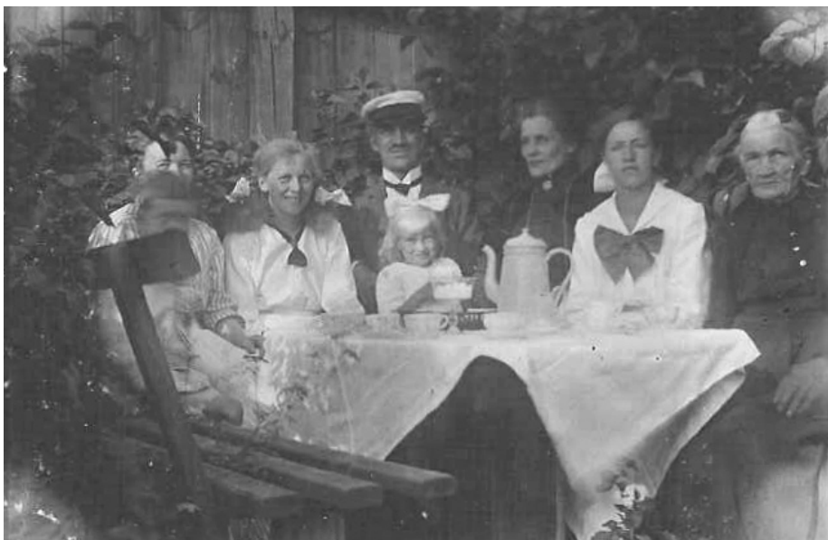
År 1917 i Ystad