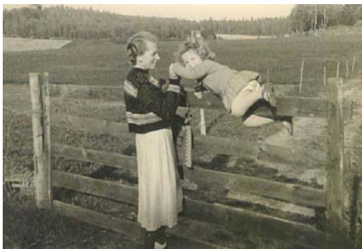
Elsa hjälper Anna över gårdsgårdsgrinden