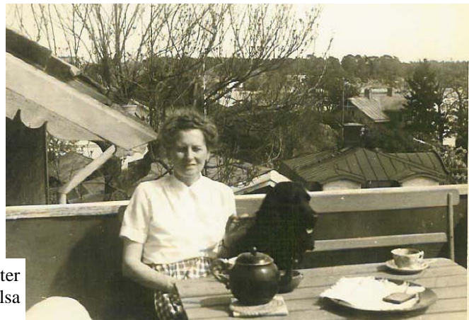
Buster & Elsa