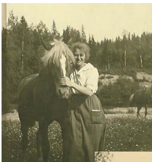
Elsa var en sann djurvän

Av fotografierna framgår bl a att familjen under barnens sommarlov ibland besökte far- och morföräldrarna i Ystad respektive Silje. Dessutom tillbringade man några sommarlov i Stockholms skärgård, t ex på Ljusterö och Vaddö. När mamma blev äldre gjorde hon tillsammans med en eller flera kamrater långa cykelturer, t ex ett år till Gränna, Omberg, Vadstena och Alvastra. Ett år, förmodligen under seminarietiden, gjorde man en turistresa till Schweiz. Redan under skoltiden blev mamma engagerad i scouterna, ett av allt att döma mycket helhjärtat engagemang.