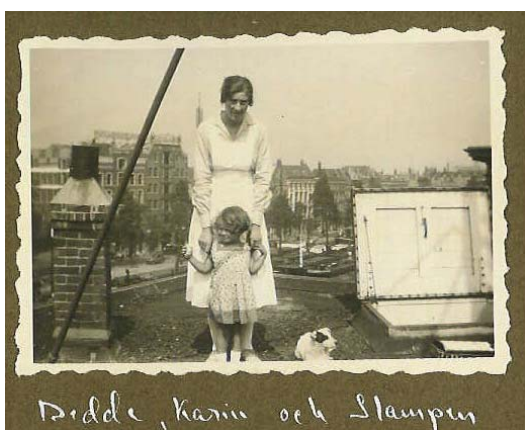
På taket i Rotterdam. (OBS inga räcken!!!)

Under alla år stod familjen i nära kontakt med Dedde.