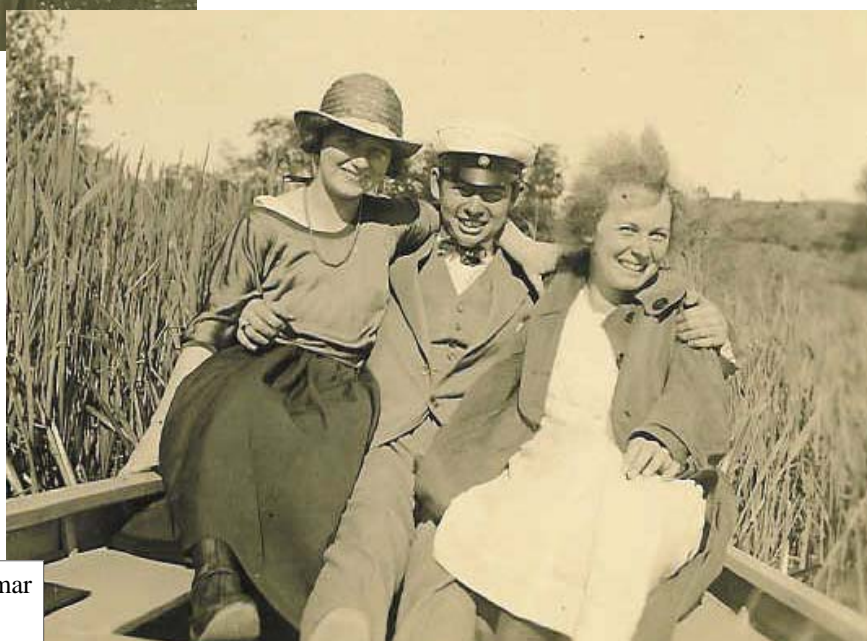
På båtutflykt till Årsta holmar med kamrater

Av fotografierna framgår bl a att familjen under barnens sommarlov ibland besökte far- och morföräldrarna i Ystad respektive Silje. Dessutom tillbringade man några sommarlov i Stockholms skärgård, t ex på Ljusterö och Vaddö. När mamma blev äldre gjorde hon tillsammans med en eller flera kamrater långa cykelturer, t ex ett år till Gränna, Omberg, Vadstena och Alvastra. Ett år, förmodligen under seminarietiden, gjorde man en turistresa till Schweiz. Redan under skoltiden blev mamma engagerad i scouterna, ett av allt att döma mycket helhjärtat engagemang.