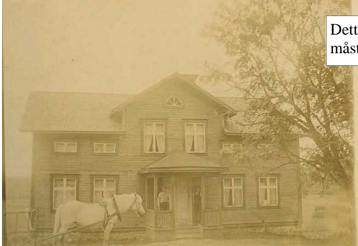
Detta är huset där Inez är född. Fadern måste gå från gården pga stora skulder.